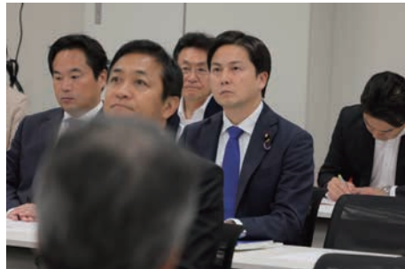
健康保険組合連合会からの要請