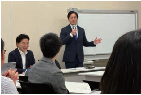
政策の実現に向けて働く仲間と議論

皆さんから寄せられた声に基づき、さまざまな課題について意見交換を重ねています。働く仲間の皆さんの想いを原動力に、掲げる「産業・職場・暮らす」#メイドインジャパンを増やすの政策実現に取り組みます。