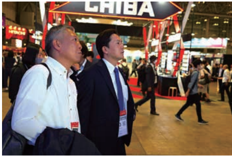
デジタル技術の見本市「CEATEC」を視察

さまざまな場に足を運び、産業の動向把握に努めています。政治が果たす役割を認識したうえで、最先端の技術に注目しながら日本の産業競争力強化に向けた活動を進めます。また、党エネルギー調査会の一員として、中国電力島根原子力発電所の視察を行いました。現実的なエネルギー政策の実現に向けて正しい情報を発信しながら、取り組みます。