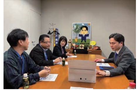
産業の課題について意見交換