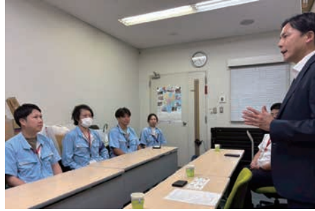
職場の課題について意見交換