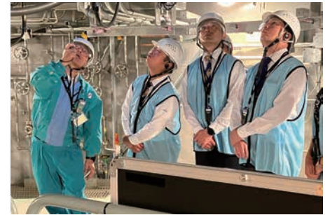
島根原子力発電所を視察