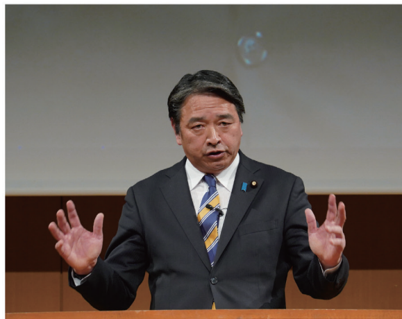
議案報告・提案を行う榛葉幹事長